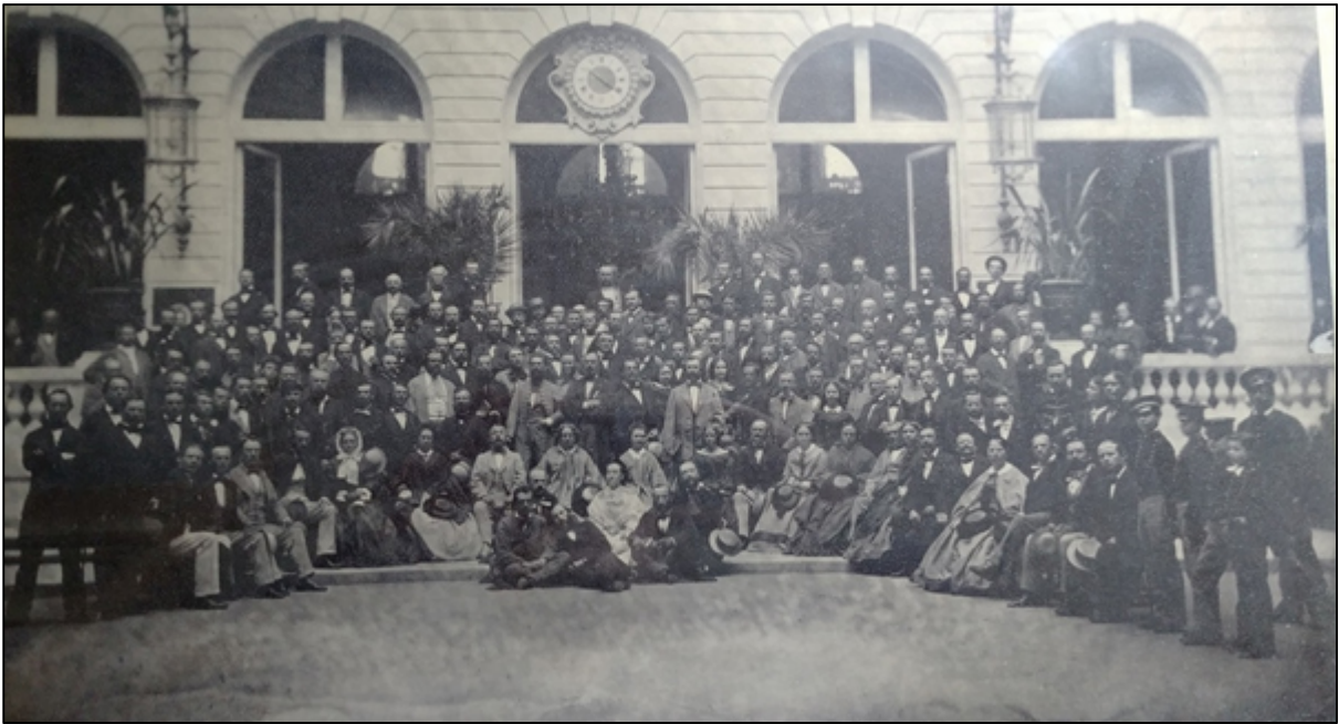
Figure 1. The photograph of the pleasure train group in front of the Grand Hotel in Paris, taken by Pierre Petit on August 8 th , 1862, at 10.20 AM (see clock). One-hundred and seventy-four persons are counted. An enlargement of the center part with Gregor Mendel is shown in Figure 5.