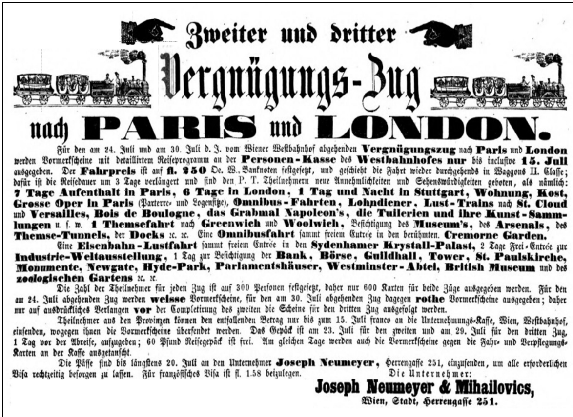
Figure 3. The advertisement for the original second and third pleasure trains to Paris and London ( Tagespost Graz 04-07-1862). For the English translation, see Appendix II.